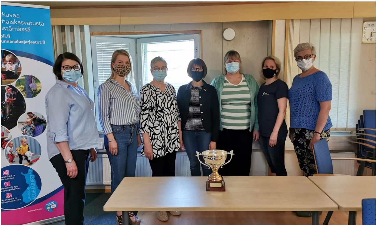
Kevätkokouksessa palkittiin perinteisesti seuratoimijoita kiertopalkinnoin.