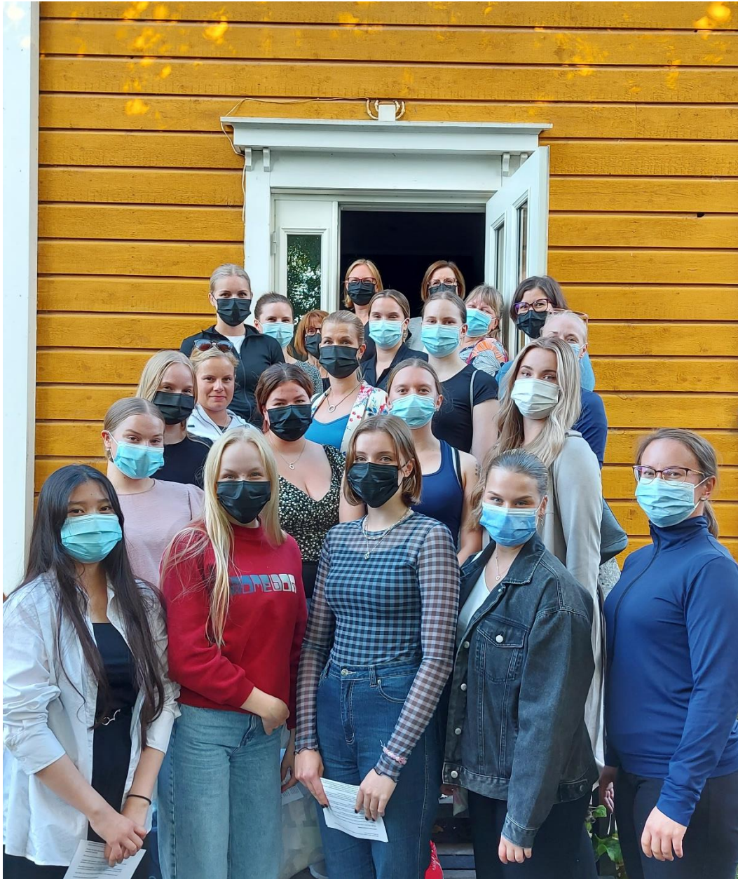
Ohjaajapalaveria vietettiin ja myös yhteiskuva otettiin ajan hengen mukaisesti maskit kasvoilla.

Oulun Voimisteluseuran edustustuotteisiin kuuluvat Piruetin sininen edustustakki ja toppi sekä laukut (2 kokoa), PromoSetin kautta hankitut sininen collegepusero sekä t-paita ja pipo. Tuotteiden esittelyt löytyvät seuran nettisivulta. Edustusvaatteita tilattiin syksyllä.