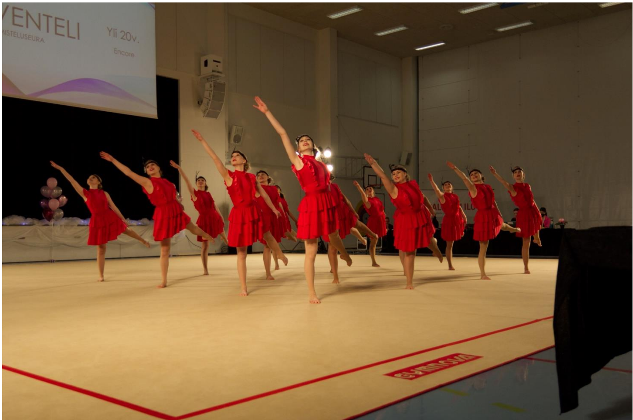
Marraskuussa tanssillisen voimistelun joukkueet pääsivät pitkästä ajasta kisaamaan. Kuvassa Laventeli.